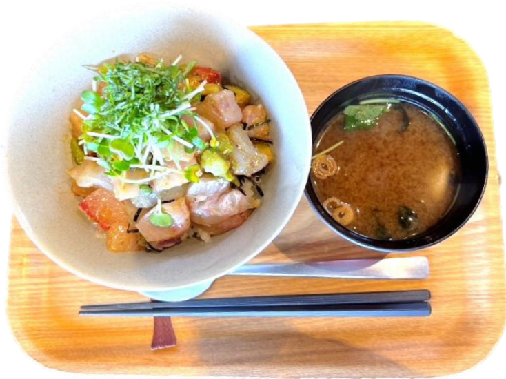
アヒポキ風 海鮮丼 Ahi poke bowl ¥2,000

LUNCH TIME 11:00~14:30 数量限定、無くなり次第 終了します